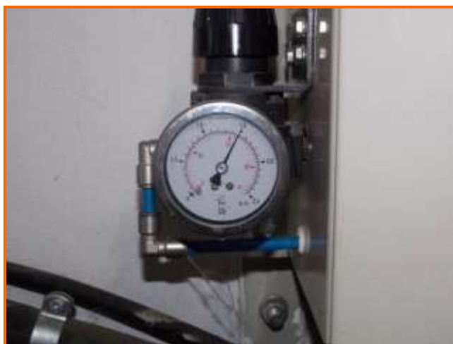
Figura 4: Dettaglio del manometro (indica 1,5 bar)

Sicuramente Achille ha avuto un comportamento superficiale nel controllare la pressione della turbina probabilmente anche a causa della perfetta conoscenza dell'impianto che lui stesso aveva realizzato.