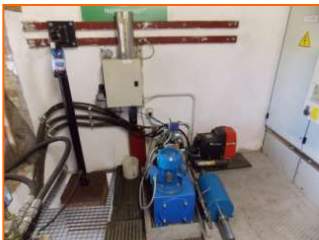
Figura 3: Sala controllo con sistema di pressurizzazione dell'impianto a turbina