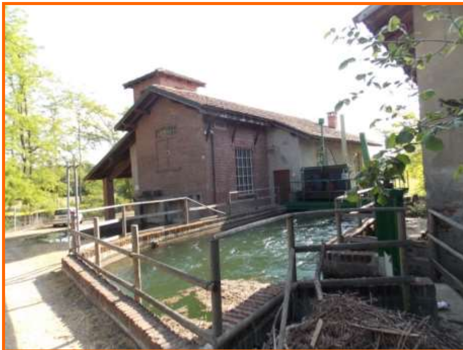
Figura 1: Mulino in cui era stata ricavata la centrale idroelettrica

L'infortunio è avvenuto nell'autunno del 2013, in tarda mattinata verso le undici e mezza nei pressi di un edificio, un vecchio mulino, all'interno di un parco dove è stata realizzata una centrale idroelettrica che sfrutta il salto d'acqua presente in un canale irriguo (figura 1).