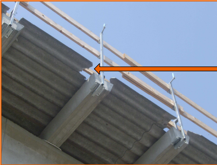
Particolare delle demolizioni delle parti esterne delle lastre di copertura in cemento amianto