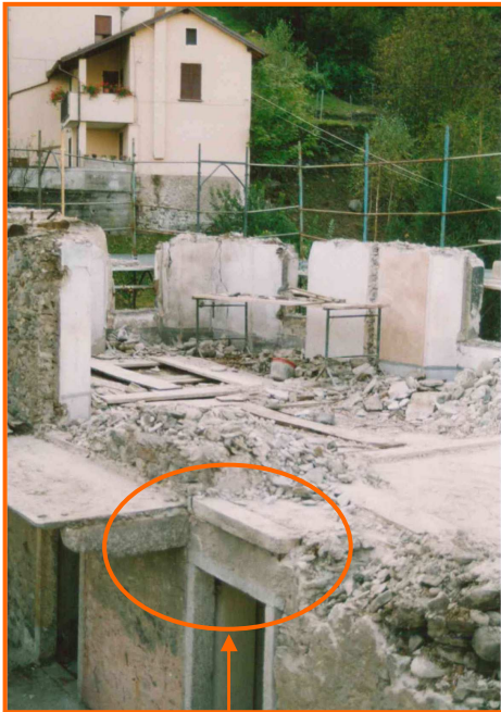
Edificio in demolizione: zona dove si trovava l'infortunato prima della caduta

L'evento si è verificato nel 2002, nel primo pomeriggio di una giornata di fine settembre, presso un cantiere edile situato in pianura.