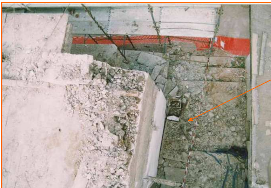
Vista dall'alto delle macerie del balcone caduto

Ambrogio, si è infortunato a seguito di una caduta da un'altezza di circa 6 metri.