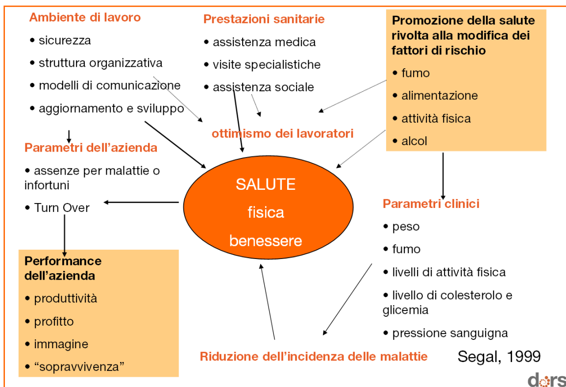
Figura 1- Gli effetti della WHP sulla performance aziendale XV .

La WHP, nata dall'incontro delle esperienze di igiene e sicurezza del lavoro con il mondo della promozione della salute, trova un suo convincente modello XVI XVII in quello sviluppato dal The Health Communication Unit del Centre of Health Promotion dell'Università di Toronto nel quale gli interventi di igiene e sicurezza del lavoro si integrano con quelli mirati ai cambiamenti organizzativi e al miglioramento degli stili di vita individuali (Figura 2) .