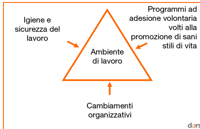
Figura 2 - Il modello canadese per la WHP (THCU, 2004).

Altro modello di riferimento è l' Healthy workplace model xviii xix , sviluppato dall'OMS sulla base delle evidenze e delle buone pratiche disponibili. Questo modello, in linea con la Dichiarazione di Lussemburgo xx (2007), parte dal presupposto che un ambiente di lavoro sicuro e salutare è quello in cui i datori di lavoro, i lavoratori e i soggetti a vario titolo coinvolti collaborano, attraverso un processo di miglioramento continuo, per tutelare e promuovere la sicurezza, la salute e il benessere di tutti i lavoratori.